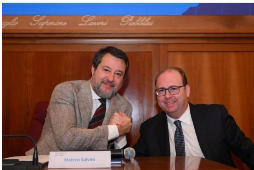
Matteo Salvini e Davide Bordoni

Roma, 29 aprile 2026 - RAM S.p.A. Logistica-Infrastrutture-Trasporti, società in house del Ministero delle Infrastrutture e dei Trasporti (MIT), ha chiuso l'esercizio 2025 registrando risultati positivi, che testimoniano il rafforzamento del suo ruolo strategico a supporto del MIT e delle principali politiche pubbliche nei settori della logistica, della portualità e del trasporto marittimo. Il valore della produzione ha raggiunto i 7,743 milioni di euro , segnando un incremento del 39% rispetto ai 5,548 milioni dell'anno precedente. Questo dato è accompagnato da una significativa crescita dell'organico aziendale, passato da 31 a 50 unità nel biennio 2024-2025 , pari a un aumento del 61%, a conferma della volontà di RAM di potenziare le proprie competenze operative.