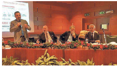
Ieri in Regione la presentazione del Patto trasporti col ministro Del Rio

«Il patto è la strada giusta per il trasporto pubblico locale», afferma il ministro Delrio. Le importanti risorse per il rinnovo dei mezzi, le nuove regole che mettono al centro la qualità del servizio, le iniziative messe in campo dal Governo e dalla Regione richiedono un lavoro attento di attuazione, molto più efficace con il coinvolgimento di tutti i soggetti interessati, per realizzare pienamente il diritto alla mobilità». «L'esperienza emiliano-romagnola può essere un esempio virtuoso in questo senso» ha spiegato il presidente Bonacini aggiungendo che «abbiamo approvato un piano di investimenti da quasi 2 miliardi di euro attuato una riforma globale definita attraverso un percorso virtuoso di concertazione tra pubblico e privato, che garantisce il 27% del servizio». Per quanto riguarda la regione e il Ferrarese, dal gennaio 2019 si arriverà a un'azienda unica per il trasporto ferroviario dell'Emilia-Romagna, che riunirà i due gestori