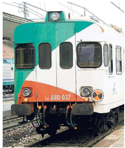
Le linee ferroviarie locali dal 2018 saranno di interesse nazionale

ne dei relativi costi. Questo per le ferrovie, mentre per il trasporto su gomma il patto prevede di arrivare alla fusione delle 9 agenzie provinciali dei gestori dei servizi pubblici autotofiltranviari in 4 nuovi soggetti con le medesime funzioni: Modena e Reggio Emilia; Bologna e Ferrara; Parma e Piacenza; Romagna, come previsto dalla legge regionale 30/98 e nel rispetto delle clausole sociali di salvaguardia dei livelli occupazionali del personale. Dunque l'agenzia Amiferrarese si fonderà con quella